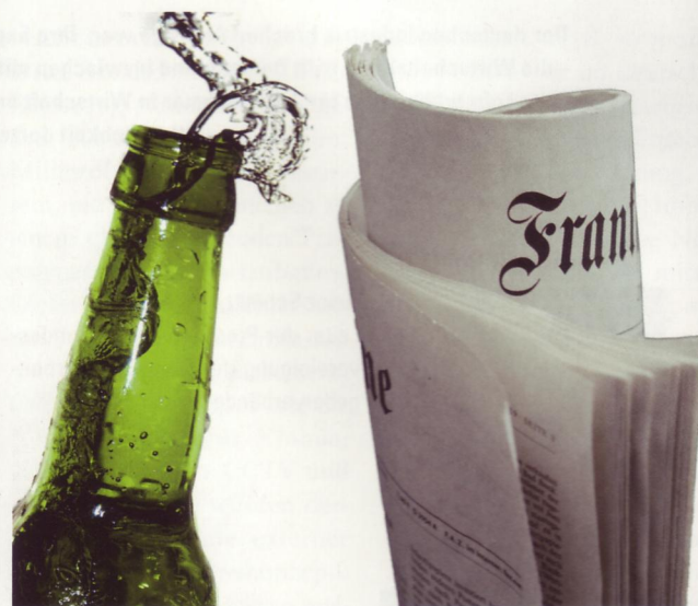
Ihre Hersteller genießen bei den Deutschen am meisten Vertrauen.

Tageszeitungen, Brauereien und Lebensmittel-Discounter genießen im Branchenvergleich das größte Vertrauen in der deutschen Bevölkerung. Zu dieser Erkenntnis gelangte jetzt eine Studie der Markenberatung Musiol Munzinger Sasserath. 44,5 Prozent der Befragten brachten Blättern wie der „Süddeutschen Zeitung“, der „Frankfurter Allgemeinen Zeitung“ und der „Welt“ großes Vertrauen entgegen. Brauereien erreichten mit 39,5 Prozent den zweiten Rang. Obwohl im vergangenen Jahr mit einem Spitzelskandal in den Schlagzeilen, be-